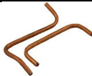
TUBES DE DETECTION D'AIR