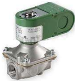
VALVE SOLENOIDE 1 1/4"