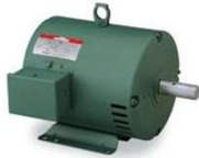
MOTEUR 1 HP