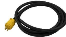
CORDE D'ALIMENTATION INCLUANT LA PRISE DE COURANT